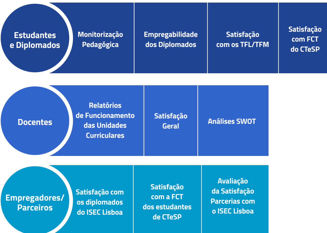
Fig. 2. Participação das diversas partes interessadas através de alguns instrumentos de monitorização do GAGQ

Para a avaliação dos ciclos de estudos é essencial que as diversas partes interessadas do ISEC Lisboa sejam voz ativa no processo de melhoria dos ciclos de estudos, que olhem para este processo como uma oportunidade para se alterar/ melhorar lacunas detetadas no decorrer do ciclo de estudos. No que respeita à intervenção do GAGQ, as diversas partes interessadas podem participar através da resposta aos instrumentos criados e/ou de forma voluntária, com sugestões de melhoria (Figura 2).