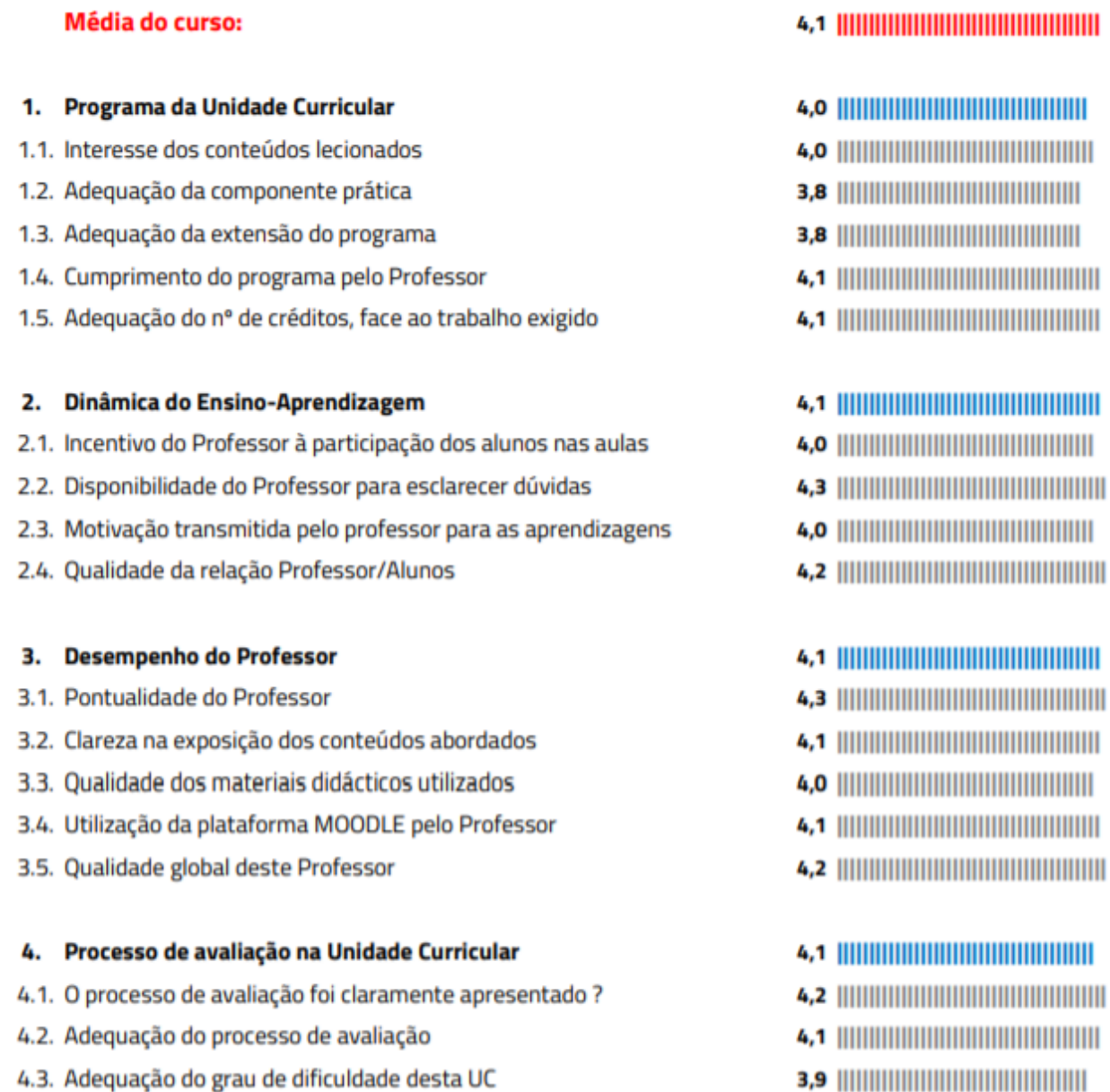
Figura 1 Resultado da monitorização pedagógica no primeiro semestre do ano letivo 2019/2020

(Disponível para consulta aqui: https://www.iseclisboa.pt/images/relatorios/RMP_GAGQ_LEST_201920_1S_Curso_V1.0.pdf )