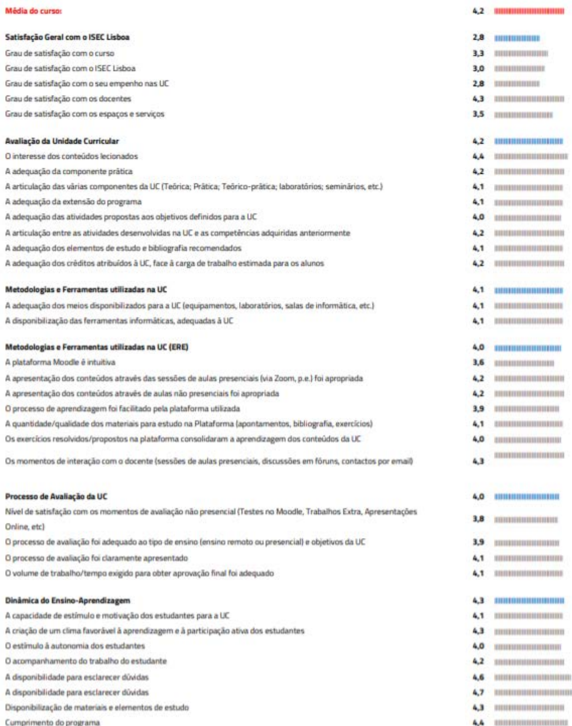
Figura 2 Resultado da monitorização pedagógica no segundo semestre do ano letivo 2019/2020 (1 de 2) (Disponível para consulta aqui: https://www.iseclisboa.pt/images/gagq/RMP_CTeSPMD_201920_25_Curso_V1.0.pdf )