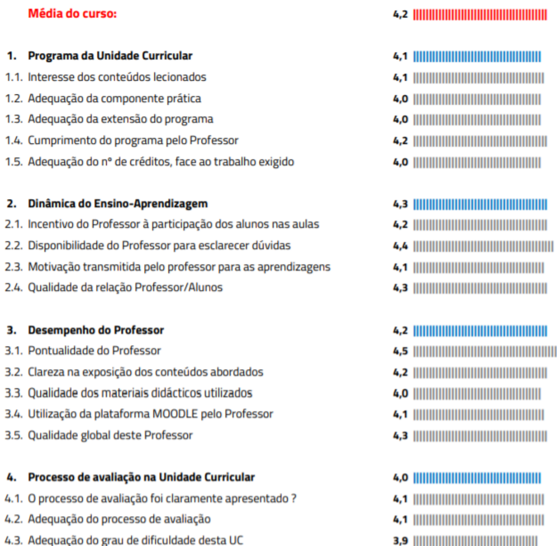
Figura 1 Resultado da monitorização pedagógica no primeiro semestre do ano letivo 2019/2020 (Disponível para consulta aqui: https://www.iseclisboa.pt/images/relatorios/RMP_GAGQ_CTeSPMD_201920_1S_Curso_V1.0.pdf )

No que diz respeito ao processo de monitorização pedagógica e, considerando uma escala entre 1 e 5, em que 1 significa Muito Insatisfeito e 5 significa Muito Satisfeito, verifica-se que no primeiro semestre de 2019/2020 a média de curso situou-se nos 4,2 (Figura 1). Fruto da evolução do próprio SIGQ-ISEC Lisboa, no segundo semestre do ano letivo de 2019/2020, foi reajustado o inquérito de monitorização pedagógica, para abarcar um conjunto mais abrangente de questões, aquando o momento de contato com os estudantes. No segundo semestre do ano letivo 2019/2020 a média de curso situou-se em 4,2, numa escala entre 1 e 6, em que 1 significa Muito Insatisfeito e 6 significa Muito Satisfeito (Figura 2). Salienta-se que não é efetuada uma análise comparativa inter semestral, devido à alteração das escalas utilizadas.